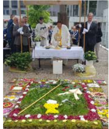
Eucharistiefeier an der Wolfgangskirche

„Wolfgang – ein Mensch auf der Suche nach dem richtigen Weg“