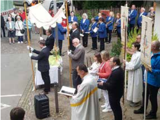
Wortgottesdienst an der Friedenskirche der EMK in der Wolfgangstraße

„Wolfgang – ein Mensch auf der Suche nach dem richtigen Weg“