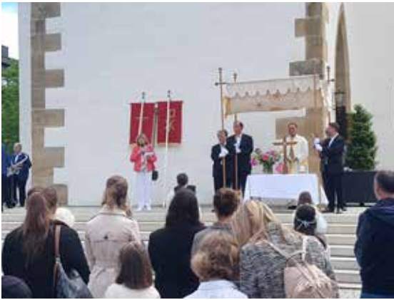
Beginn des Gottesdienstes an der Martinskirche/ am Marktplatz.

„Wolfgang: Geburt und Taufe in Pfullingen“