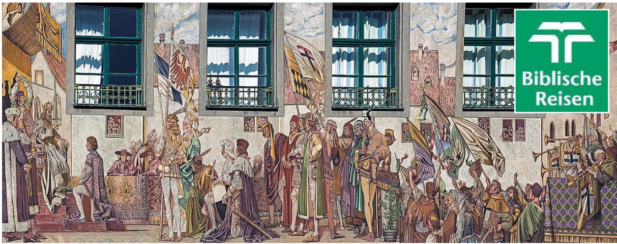
Konstanzer Konzil, Fresken am Häuserensemble Wessenbergstraße/St. Stephans-Platz/Münzgasse

Herrliche Tage wollen wir in der wunderschönen Landschaft zwischen Bodensee und Genfer See erleben. In den drei Städten Konstanz, Genf und Basel werden wir unter sachkundiger Führung die dortigen Sehenswürdigkeiten entdecken und in den Altstädten in die Geschichte eintauchen. Wir werden uns an kompetenter Stelle über den beeindruckenden Prozess der weltweiten Ökumene informieren lassen und dabei Verbindungen zu unserer gelebten Ökumene vor Ort ziehen können.